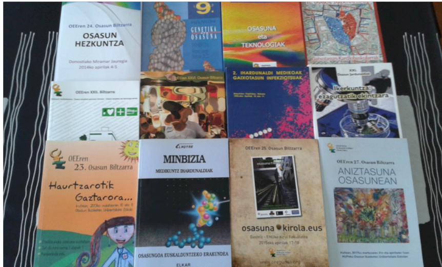
1. irudia. OEEren urteroko biltzarretan argitaratutako zenbait libururen azalak.