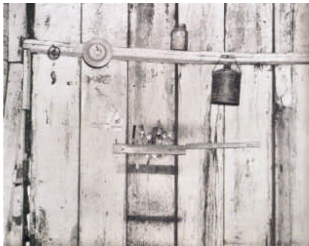
15. Irudia: Walker Evans, Laborari baten etxeeko horma , Alabama, 1936

Berak erretratatuak dendetako apalak ikusirik auzoen beharrak zeintzuk ziren erakusten du. Nahiz eta pertsonen erretratuak ere egin, fama natura hilen irudien bidez lortu zuen: apalak, denden erakusleihoak, etxeetako hormak, etab.; aurretiko ikuspuntutik hartuta bizimodu bati buruzko collage esanguratsuak osatzen dituzte.