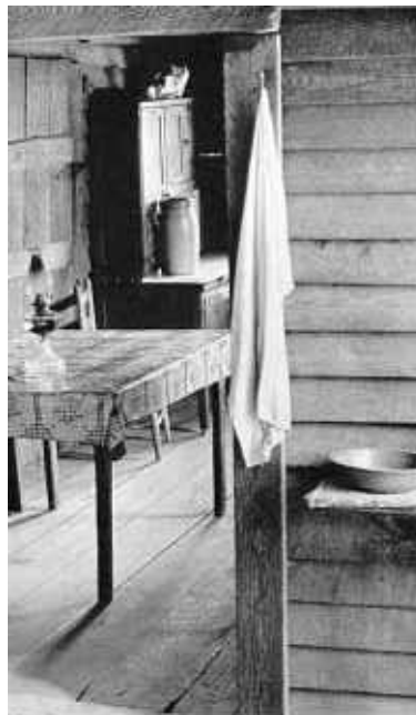
9. Irudia: Walker Evans, Barrualdea