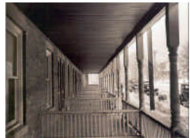
12. Irudia: Carl Mydans, Etxe segida baten baranda , 1936

FSAk utzitako oinordetza ez da argazkigintzan soilik izan, soziologiko, antropoligiko eta emozionala ere bada. Emakumeek betetako papera eta jasan izan behar izan zutena erakusten du adibidez, heroien pare ikus daitezkeelarik. Lange-k zera esan zuen: Emakume hauek amerikar lurrekoak dira, arraza gogor bat, gure herrialdearen sustriak. Gure lautada, zelai, desertu, mendi, bailara eta