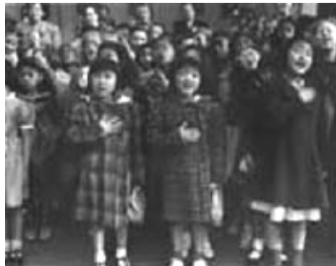
20. Irudia: Dorothea Lange, Raphael Weill eskolan "Pledge of Allegiance" Abesten ebakuazioa baino aste batzuk lehenago , San Frantzisko, 1942

Bigarren Mundu Gerrarekin Lange-k berriro ere gizartearen aldaketak eta mugimendua jaso zituen. Pearl Harbour gertatu eta hiru hilabete geroago Roosevelt-ek amerikar-japoniarrak Hegoaldean kontzentrazio-esparruetan sartzeko agindua eman zuen eta hortik gutxira U.S. War Relocation Agency (1942) (AEBko Gerrako Berkokatze Agentzia) Lange kontratatu zuen auzo japoniarrak, esparruko harrera zentroak eta instalazioak erretratatzeko. Alde batetik ausardia eta dignitatea eta bestetik atxiloketen duintasun eza biltzen zituen bere argazkietan. Argazki hauetako batzuk debekatu egin zituzten.