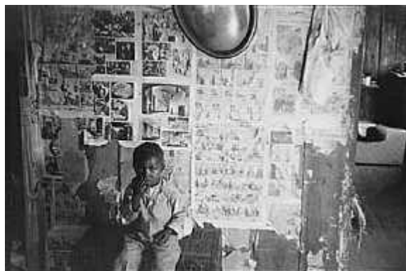
18. Irudia: Ben Shahn, Maizter baten etxearen barrualdea , Louisiana, 1935

Bere lanik ezagunenetakoa Sacco eta Vanzetti-ren pasioa da. Hogeita hiru zatiz osatutako mural bat da eta justizia federalari kritika egiten dio. Nicola Sacco eta Bartolomeo Vanzetti anarkista italiarren auzia jasotzen du, beraiek burutu ez omen zituzten delitu batzuegatik 1927an exekutatuak izan zirenak. Auzi honek eztabaida internazionala piztu zuen eta askok uste zuten beraien ideiegatik epaituak izan zirela eta ez froga garbiengatik. Shahn-ek kezka hauek jaso eta artearen bidez erakutsi zituen.