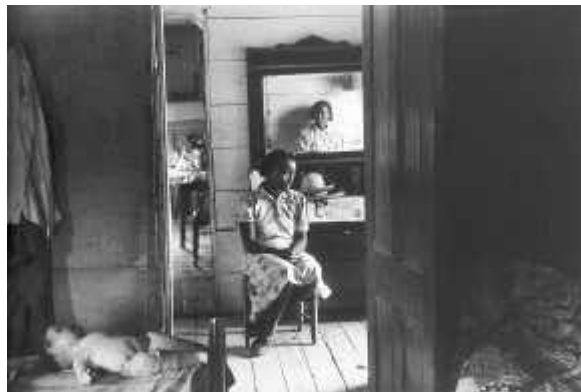
16. Irudia: Jack Delano, FSAko bezero baten alaba, Green County, Georgia, 1941

Kiev-en, Ukrainan, jaio zen 1914an familia judutar batean. Berezko izena Jacob Ovcharov zuen. Ama Armada Gorriko kapitaina izan zen eta aita irakaslea. 1923an AEBra joan ziren eta Filadelfia iparraldean, Bristol-en ezarri ziren. Hasieran musika ikasketak egin zituen Curtis Institutuen ; Errusiako familia txiro baten ametsa seme-alabak musikari famatuak bihurtzea izaten baitzen. Gero, 1932-1936 bitartean Pennsylvania-ko Arte Ederren Akademian sartu zen eta ilustrazio eta diseinu grafikoan espezializatu. 1936an European zehar bidaiatzeko beka bat lortu zuen eta bertan museo eta artelan garrantzitsu asko ikusteaz gain bere lehen argazki makina erosi zuen. Berak esan zuenez hasiera batean argazkiak turista gisa ateratzen zituen baina espresio bide bat bezala interesatzen hasi zitzaizkion pixkanaka.