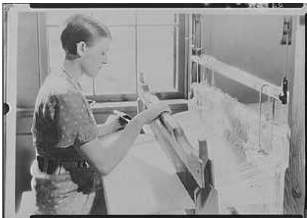
5. Irudia: Carl Mydans, Emakumea ehuna egiten , Crossville, Tennessee, 1935

FSAko argazki hauek Nekazari Saileko liburuxketan eta prentsan argitaratu ziren. 1937an, sortu berria zen Life aldizkarian, gai honen inguruko zenbait artikulu idatzi ziren, Lange, Shahn eta Rothstein-en argazkiekin batera. 1938an FSAko argazkilariak landa-munduko argazki baikorragoak ateratzen hasi ziren, hasierako programa zabalduz eta gaia gizartea bere orokortasunean bihurtuz. Hegoaldeko argazkiez gain hiri eta industrien irudiak jasotzen hasi ziren. Garai honetan taldean beste partaide batzuk sartu ziren: Marion Post Walcott, Jack Delano, John Vachon eta John Collier.