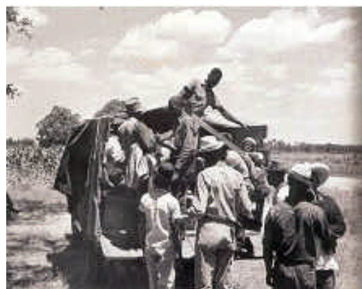
3. Irudia: Jack Delano, Irtetear dauden langile migratzaileen prestaketa , Ipar Karolina, ca. 1940

Landutako lurren gutxitzeak eta traktoreen erabilerak nekazari familia asko Kaliforniara bidean jarri zituen jornalari emigrante bihurtuz.