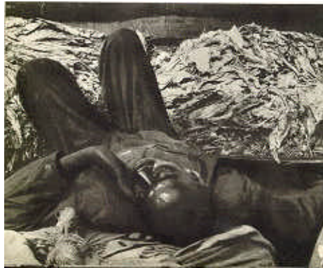
8. Irudia: Margaret Bourke-White, Enkantea zuzentzen duenak hain azkar hitz egiten du gizon beltzak ez dakiela bere tabako uzta zenbatean saltzen den

orokorrean Bourke-White-nak baino inperpersonalagoak dira. Aipatutako ironia puntua erakusten duten notatxoez lagunduta daude (ikus ondoko irudia).