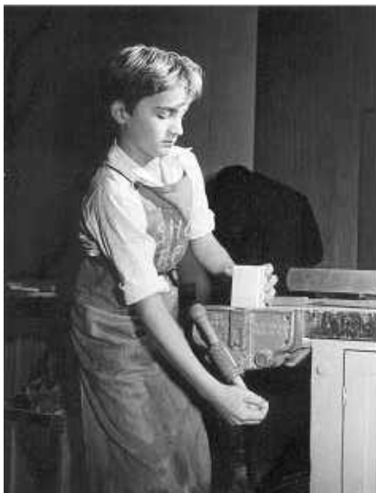
2. Irudia: Arthur Rothstein, Umea dandari lana ikasten , Radolph County, West Virginia, 1941eko abendua.

Depresioaren eragin harrigarrienetako bat nomadismoa izan zen. Momentu konkretu batean bost milioi ibiltari egon ziren, lan bila edo asperralditik eta desesperaziotik ihes egin nahian. Noraezean zebiltzanen laurden bat gazteak ziren, eta New Deal-aren National Youth Administration engatik izan ez balitz kopurua askoz handiagoa izango zen. 600 000 bat unibertsitariori eta bigarren hezkuntzako 8 milioi ikasleri egun erdiko lanak eman zizkien; horrela ikasten jarrai zezaketen eta merkatutik at zeuden.