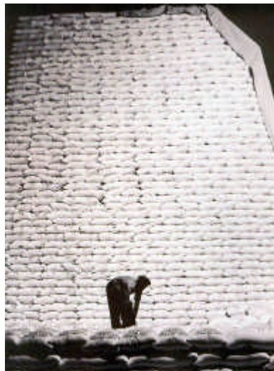
11. Irudia: Jack Delano, Azukre zakuak , 1940