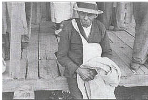
1. Irudia: Ben Shahn, Kotoi biltzailea , Arkansas, 1935

1934an kongresurako hauteskundeetan progresistak indartu egin ziren, 1935 hasieran Auzitegi Gorena New Deal-aren neurri batzuk baliogabetzen hasi zen, eta ekonomiak oraindik geldirik zirauen. 1935ean Roosevelt-ek bira taktiko bat eman, eta emaitza lege multzo uholde berri bat izan zen, historialari batzuk Bigarren New Deal-a deitzen diotena. Bigarren tratua erradikalagoa da, erreforma sozial eta ekonomikoa eta gutxien dutenen aldekoa. Aurreko tratuaren jarraipenak zeuden eta kapitalismoa zaintzeari garrantzia eman zioten. Roosevelt emaitzak jasotzen hasi zen, Work Progress Administration sortu zuen, ondoren Work Projects Administration (WPA) bihurtuko zena. WPAk langabezia gutxitu nahi zuen, horretarako proiektu ezberdinak martxan jarritz. Proiektu hauen artean, egitasmo bitxiak ere bultzatu ziren, halanola lan gabeko artista, musikari, idazle eta aktoreei laguntzeko sortutakoak.