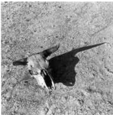
10. Irudia: Arthur Rothstein, Burezurra , Badlands, South County, 1936

Kritikak eta eztabaidak laster hasi ziren, argazkiek izaera dokumentala izateaz gain metafora gisa uler baitzitezkeen eta garai horretan konnotazio politikoak nonahi aurkitzen ziren. Kritika askok argazki arriskutsuak zirela uste zuen. Arthur Rothstein-en argazki batek (ikus 10. irudia) eztabaidak sortu zituen erakusketa batean eta heriotzari dei bat bezala uler zitekeela seinlatu zen. Metafora desberdinak ikusteko ondorengo adibideak egokiak izan daitezke: 11. irudia krisiari aurre egiteko egin beharreko itzeleko esfortzuaren isla eta 12. irudia etorkizuneranzko begirada izan daitezke. 1938an New York-en egindako erakusketa batean ere kritika gogorrak jaso zituzten eta ondorengo esaldiak entzun ahal izan ziren: Erakutsi pribilegiatuak ez direnei ume eta miseria gutxiago izaten; Ez erabili zergen dirua filmeetan; Uste dut Hitler bat behar dugula; komunismoaren propaganda hutsa; Kiratsa dario; Argazki hauek ikusi ondoren pozten naiz New York hirian bizitzeaz Kasuotan egokia litzateke egiak min egiten duela esatea.