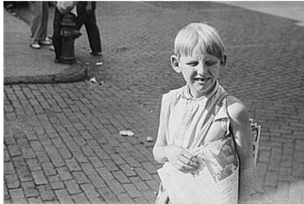
17. Irudia: Ben Shahn, Egunkaria saltzen duen umea , Newark, Ohio, 1938

Ben Shahn-ek injustizia eta bidegabekeria gorroto zituen. Kontzientzia sozial hau, bihozberatasuna eta justizia zentzua etorkin bat izateak eta langile mugimendu aurrerakoiaren partaide izateak beharbada indartu egin zuen. Artea batez ere mezu sozial bat bidaltzeko bide gisa ikusten zuen eta bere lan alegorikoetan gerra, holokausto nuklearra, langile eskubideak, gizarte justizia, zentsura, eta aurrerapen teknologikoaren arriskua bezalako gaiak erabili zituen.