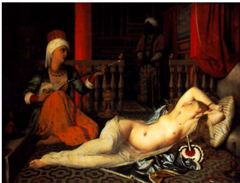
Odaliska esklabuarekin , Jean Auguste Dominique Ingres, 1839

Emakumeen gorputzek guztiz erakarri zuten Ingres eta formaren inguruko bere ikerketa emakumearen gorputzaren bidez gauzatu zuen. Emakumea behin eta berriro errepikatuko den elementua izango da eta ekialdeari lotuta aurkezten digu. Haremaren gaia maiz jorratu zuen exotismoz beteriko eszenak gauzatu. XIX. mende hasiera hartan, harem bat errepresentatzea biluziak askatasunez irudikatzeko aitzaki paregabea zela ere aipatu beharrekoa da. Burutuko dituen eszenetan atmosfera guztiz sentsuala izango da. Ekialdean inoiz egon ez bazen ere, bere kideei bertako objektuak uzteko eskatzen zien eta era honetan girotze aproposa lortu ohi zuen. Era berean aipatzekoak dira garaian guztiz eskandalagarriak suertatu ziren zenbait lanetan azaltzen diren konnotazio erotikoak. Ekialdeko mundua gaitzat duten Ingresen artelanen artean aipatzekoak dira besteak beste; " Haremaren barruan ", " Odaliska handia ", " Valpiçongo bainularia ", " Odaliska esklabuarekin ".