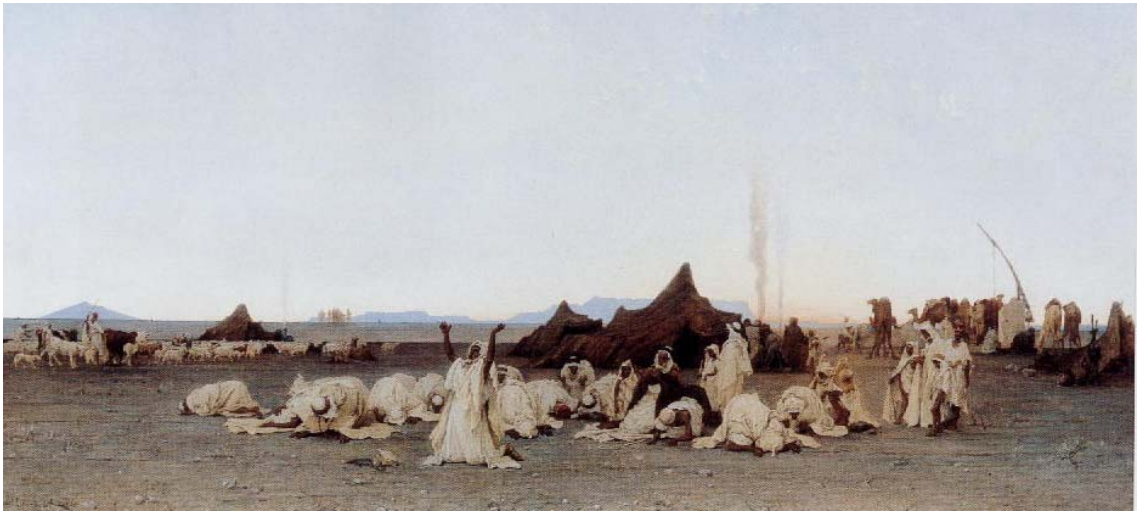
Arratsaldeko otoizlaria Saharan, Gustave Guillaumet, 1863

lanetan, Japonia eta Txinarekiko zaletasuna hauengan piztu aurretik jada, orientalismoari arreta berezia eskaintzen zitzaiola.