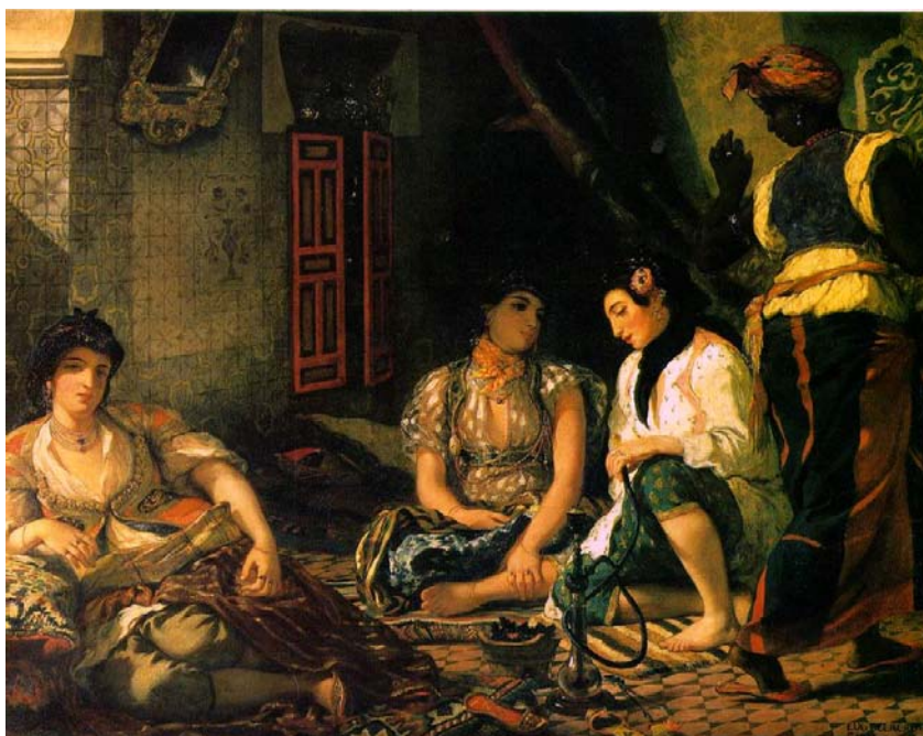
Aljeriako emakumeak , Eugène Delacroix, 1834

Delacroixek bertan primitibismoaren adierazpena aurkitu zuen. Gizaki eta naturaren arteko lotura estua zuen mundu bat ezagutu zuen. Neoklasikoek benetako edertasuna Grezian eta Erroman ikusi zuten bitartean, Delacroixek ekialdean bizirik ikusiko zuen antzinatea. Souvenirs d'un voyage dans le Maroc liburuan adierazi zuenez: "Erroma jada ez dago Erroman... erromatarak eta greziarrak hemen daude nire atarian; Daviden konposizioetako greziarretaz barre egitea ezin izan dut eragotzi... hemen ezagutu ditudalako."