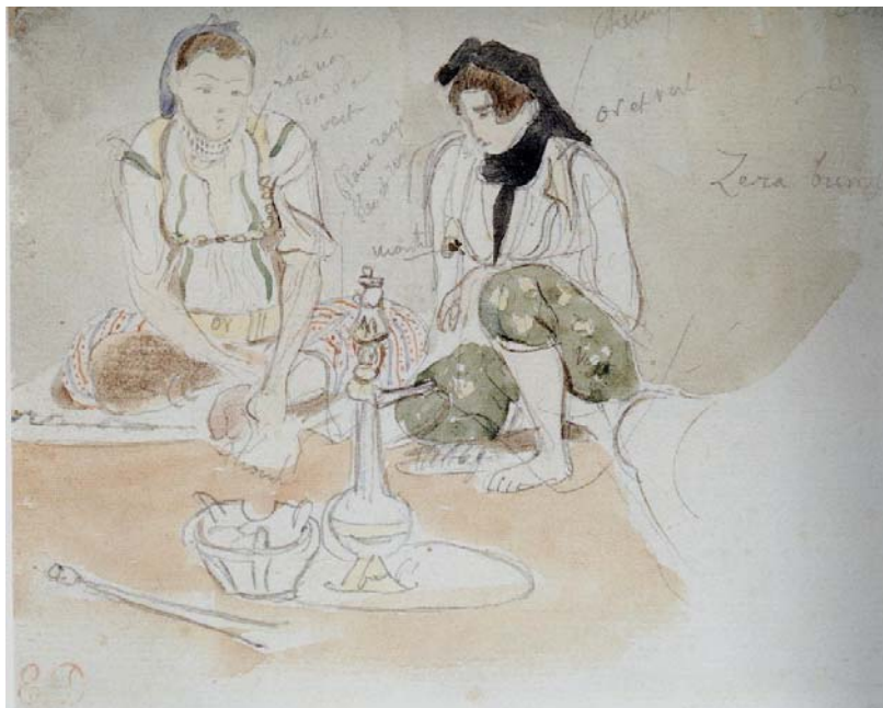
Emakume arabiarak exerita (Aljeriako emakumeentzako zirriborroa) Eugene Delacroix, 1832

Delacroixek bertan primitibismoaren adierazpena aurkitu zuen. Gizaki eta naturaren arteko lotura estua zuen mundu bat ezagutu zuen. Neoklasikoek benetako edertasuna Grezian eta Erroman ikusi zuten bitartean, Delacroixek ekialdean bizirik ikusiko zuen antzinatea. Souvenirs d'un voyage dans le Maroc liburuan adierazi zuenez: "Erroma jada ez dago Erroman... erromatarak eta greziarrak hemen daude nire atarian; Daviden konposizioetako greziarretaz barre egitea ezin izan dut eragotzi... hemen ezagutu ditudalako."