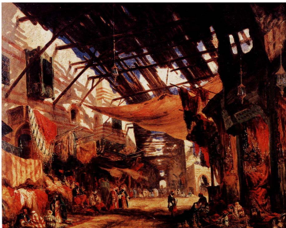
Kairoko bazaara , William James Müller, 1843.

Hainbat artistek egin zituzten Istanbulerako errepresentazioek ere aipamen bat merezi dute. Orokorrean esan dezakegu, artistak nahiko goiz bidaiatu zutela Istanbulera –David Wilkie esate baterako 1828rako jadanik Istanbulen zengainontzeko lurralde islamiarrak baino eskuragarriagoa zelako. Bestetik, gogoratu behar dugu, Europarrak bertan aritu zirela mende hasieratik mendebaldartzea bultzatzeko presioa eginez. Eta hala, Istanbulera joan ziren kontsul eta eskoletan, zein armadan irakatsiko zuten maisu berriekin batera, margolariak ere joan ziren bertara. Aipatzekoa da, zenbait kasutan otomandarrek beraiek eskatu zutela margolari hauen etorrera mendebaldeko pintura euren kulturari integratu nahi zutelako. Adierazgarria da, adibidez, Guillaumet-ek “Académie de Peinture et Dessin” izeneko margogintza akademia sortu zuela bertan eta honetatik Sarkis Direnyam edota Seker Ahmed Pasha bezalako pintore otomandar ospetsuak atera zirela. Istanbulerako populazioan Europarren kopuruak gora egin zuen etengabe eta ondorioz bertako exotismoa pixkanaka murrizten joan zen eta margolariak beste norabide batzuk hartu zituzten.