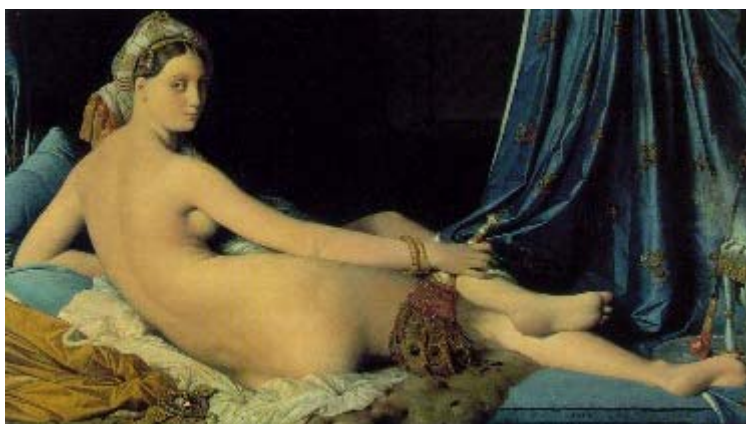
Odaliska Handia , Jean Auguste Dominique Ingres, 1814

Ikuspegi irreal hau eskaintzen diguten artisten artean, bereziki interesgarria dugu Jean-Auguste Dominique Ingres (1780-1867) pintore frantziarra. Lehenengo eta behin, Ingresek bere burua neoklasikotzat jotzen zuela aipatu beharrean gaude. 1820-1830 bitarteko hamarkadan Frantzian neoklasizismo eta erromantizismoaren arteko benetako haustura gertatu zenean Ingres aurkituko dugu korrante neoklasikoaren buruan. Hala eta guztiz ere, Ingresengan neoklasizismoa estilo piktorikora mugatua geratzen dela esan dezakegu, erabiltzen dituen gaiak eta bere helburuak erromantikoak baitira. Hau guztia horrela izanik, Ingresen obran klasizismo erromantiko bat ematen dela esan dezakegu, Delacroixen erromantizismo koloretsutik eta Daviden klasizismo arrazional eta latzetik urruntzen delarik. 4 Gorabehera honen guztiaren inguruan Théophile Gautier idazle erromantikoak Ingresen obra defendatuz adierazten duena guztiz esanguratsua da. Gautier-en arabera "honek (Ingresen obrak) klasiko antza izan dezake azaleko ikusle baten begien aurrean, baina inolaz ere ez da hala". 5