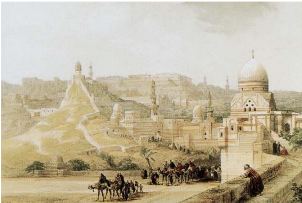
Kairoko ziutadela , Louis Hagheren litografia, David Robertsen akuarela batetan oinarrituta, 1838-39.

Islamiar lurraldeetan konkistek eta kolonialismoak aurrera egiten zuten heinean, exotismoak, argiak eta bizimodu primitiboak bultzatuta bertara bidaiatuko duten artisten kopurua geroz eta handiagoa izango da.