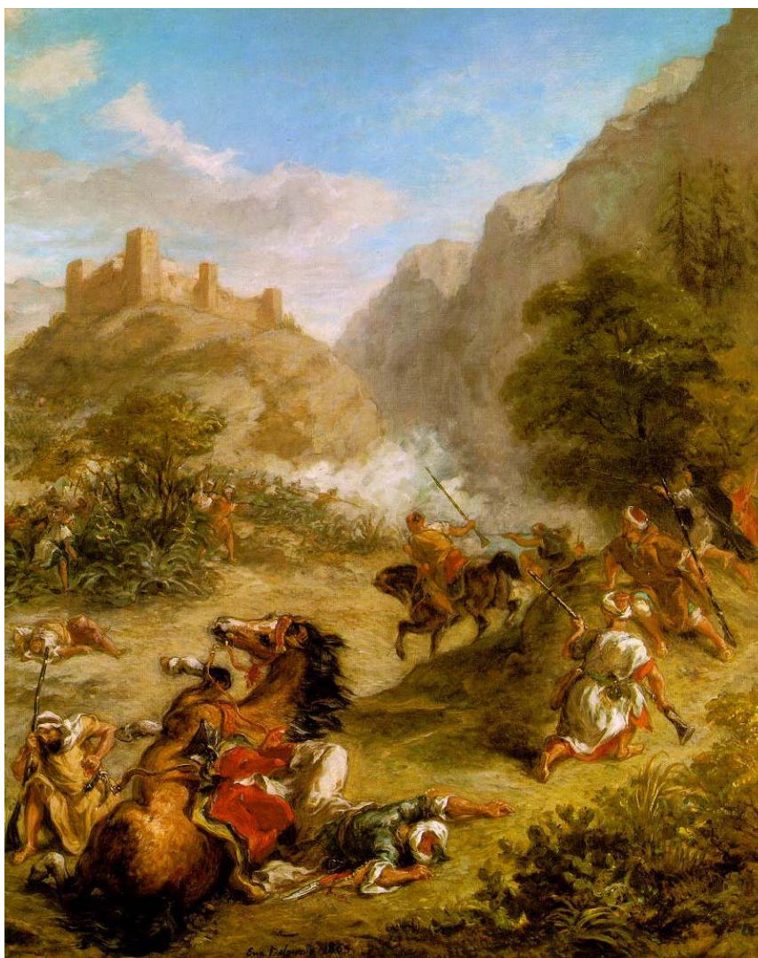
Ariketa militarra Marokon, Eugène Delacroix, 1847

Delacroixek erabilitako teknikari dagokionez esan beharra dago, Marokon, akuarelaz eginiko zirriborroz bete zituela zazpi koadernotxo. Frantziara itzuli zenean Marokon hartutako ohar hauek guztiak erabili zituen behin betiko lanak burutzeko. Aipatzekoa da, akuarelaz eginiko zirriborroetan kolore errealei buruzko oharak ere hartu zituela eta ondorioz Delacroixek kolorez beteriko konposizioak gauzatu zituen. Beti bere esperientzian eta gai errealetan oinarritu zen eta ikuspegi errealista bat eskaintzen digu "Aljerreko emakumeak", "Marokoarren ariketa militarra" ... bezalako lanetan. Delacroixekin orientalismoari eman ziztaion bultzada benetan handia izan zen eta bere obrak eragina izan zuen artista askorengan.