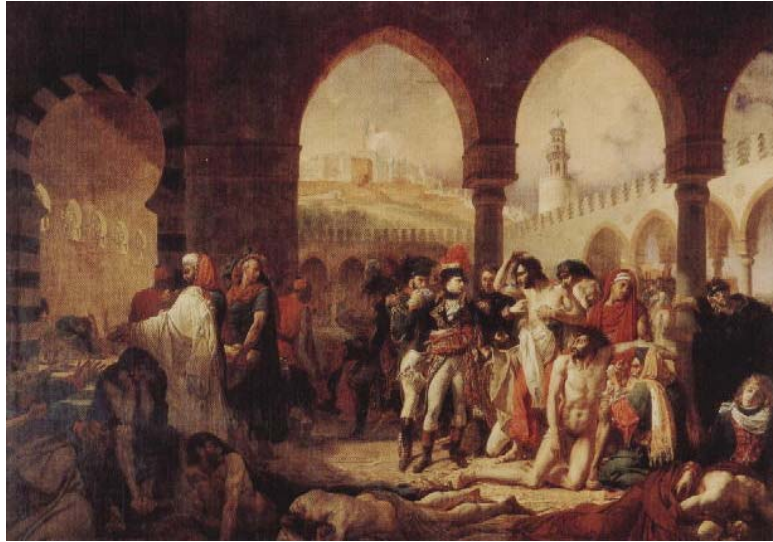
Jaffa ko izurrituak, Antoine-Jean Gros, 1804

Lehen pausu hauen barruan aipatzekoa den beste pintore bat Denon da; berak ere Napoleonen kanpainetan parte hartu zuen, eta baita hauei buruzko memoria batzuk idatzi ere; behin Egiptotik itzulita, Nazaretheko bataila erakusten zuen koadroen lehiaketa bat antolatu zuen, Grosek irabazi zuena, eta Napoleonen garaitzak argi eta garbi glorifikatzen zituen. Honek Napoleonen inguruko gaiak sortu zuen irrika erakusten du.